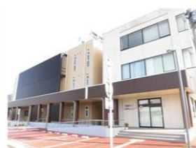
秋葉区役所小須戸支所 約250m