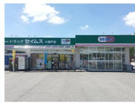
ドラッグセイムス 約570m