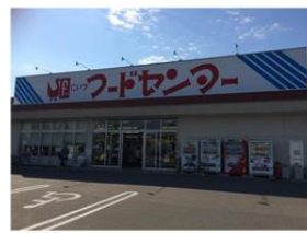
にいつフードセンター 約300m