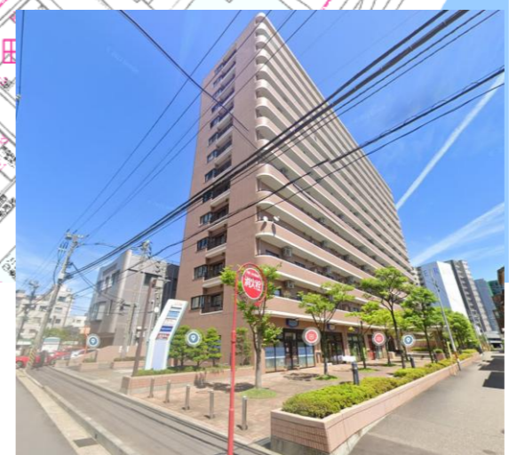
※図面と異なる場合は、現況を優先いたします。