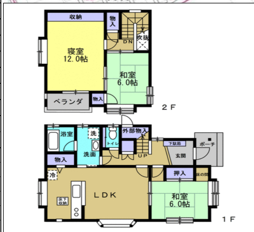
※図面と異なる場合は現況を優先いたします。