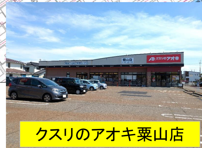
クスリのアオキ栗山店