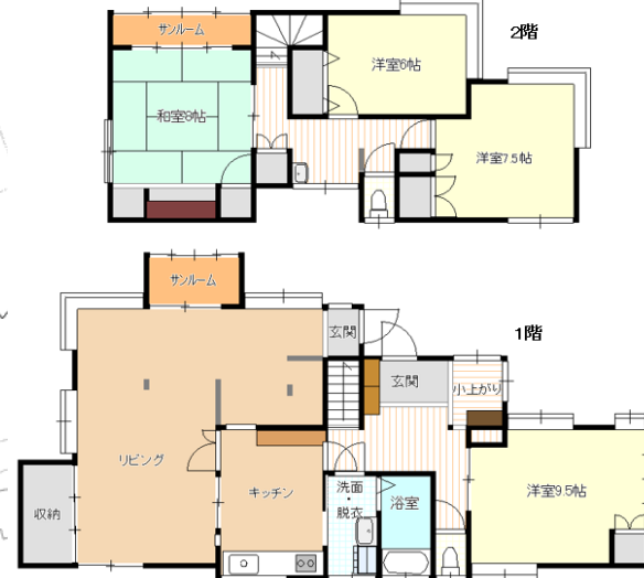
※図面と現況の差異は現況を優先とします